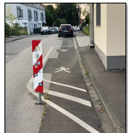
Lösungsansatz: Brauweiler, Langgasse

In Dansweiler gibt es Bürgersteige, die nur wenige Zentimeter breit sind. Bürger*innen hatten uns dazu angesprochen und einen Lösungsvorschlag aus Brauweiler unterbreitet. Gemeinsam haben wir uns an verschiedenen Stellen die Situation mit besonders schmalen Bürgersteigen vor Ort angesehen. Daraufhin hat die „WfP“ einen Antrag an die Stadtverwaltung für die erste Sitzung des Ausschusses für Tiefbau und Verkehr 2024 gestellt. Aufgezeigt haben wir dabei zwei Situationen in der Hermannstraße und eine am Heckenweg. Worum geht es dabei? An manchen Stellen sind die Bürgersteige so schmal, dass Fußgänger*innen auf die Straße treten müssen. Erschwert durch parkende PKWs wird man gezwungen, mitten auf der Straße zu gehen. Ein besonderer Schutz gilt hier Schulkindern, Senior*innen mit Rollatoren und Eltern mit Kinderwagen.