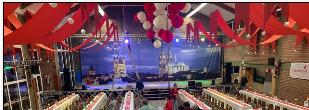
„Wir für Pulheim“ sorgt für eine neue Bühne in der Dansweiler Mehrzweckhalle